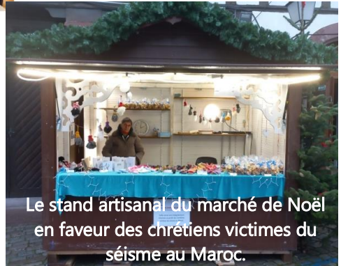
Le stand artisanal du marché de Noël en faveur des chrétiens victimes du séisme au Maroc.